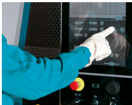
Komfortable Bedienung mit Multi-Touchscreen