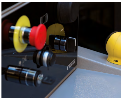
Zusätzliche Bedienelemente für schnellen Zugang und Steuerung der Maschine